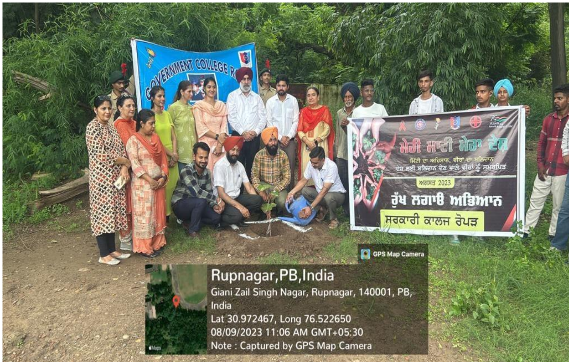
The Principal, Staff and students planting the trees